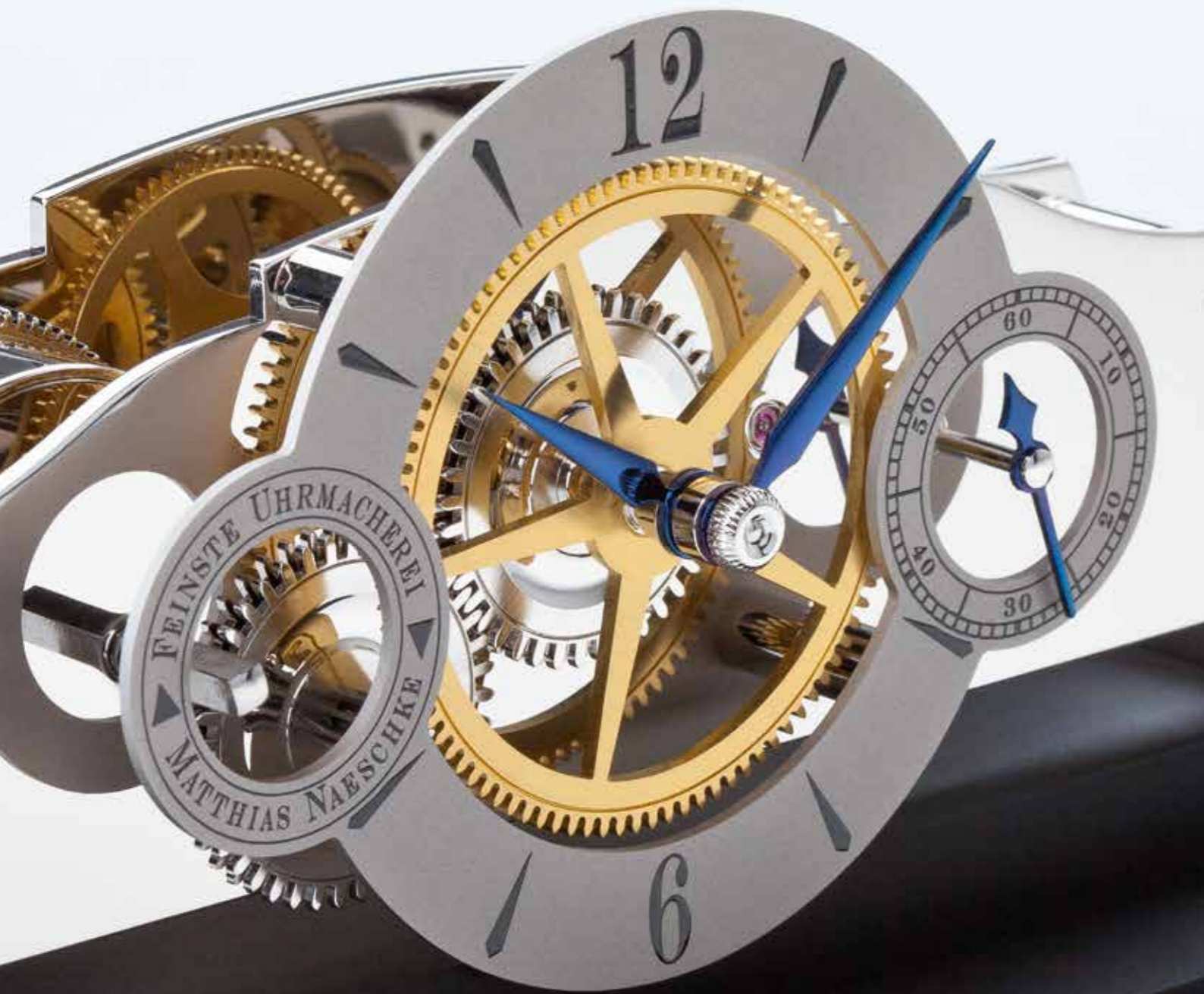
Tischuhr NT 5 · Table clock NT 5